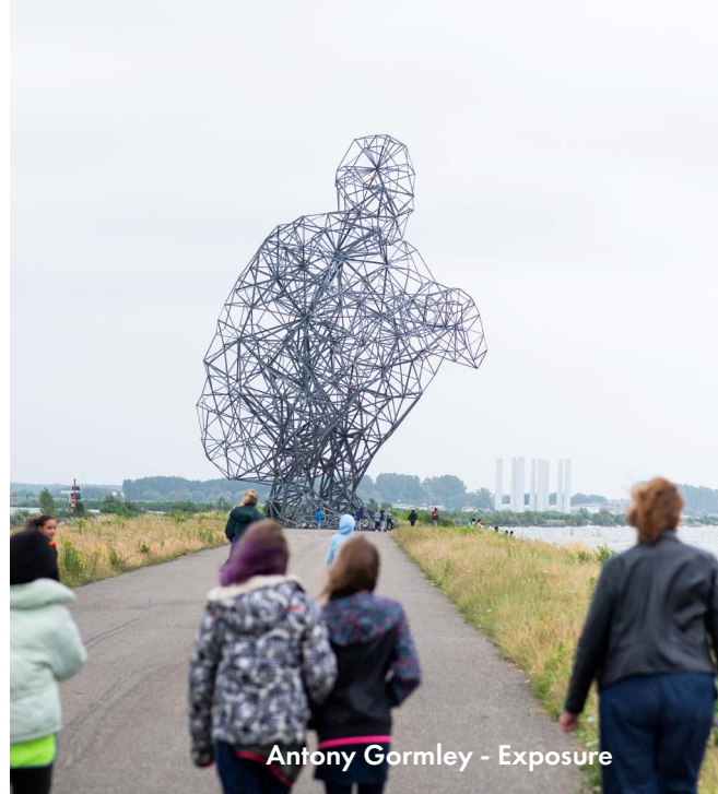
Antony Gormley - Exposure

PUBLIJK: KINDEREN VANAF 6 JAAR EN HUN OUDERS/VERZORGERS WONEND IN FLEVOLAND EN DAARBUITEN SPEELPLEKKEN: MARKERSTREK DAM BIJ BATAVIAHAVEN IN LELYSTAD PARTNERS: CULTUURPLUS (FLEVOLAND, FCP, CMK, FLECK), FONDSEN ALS HET CULTUURFONDS, FONDS21, VSB EN/OF BANKGIROLOTERIJ EDUCATIE: ONDERDEEL VAN KIDD